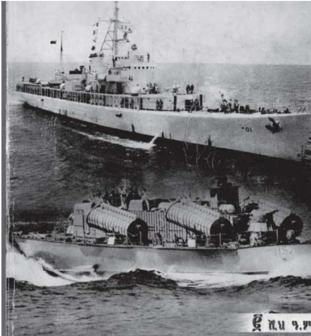
ብሓይሊ ባሕሪ ተጋደልቲ ዝተደምሰሳ ዘመናውያን መራኽብ ውግእ ደርጋውያን

እቲ ዘሰንብድን ዘሕዝንን፡ ካብ ደቕቕ ናብ ደቕቕ ዝተፈላለዩ ጸብጻባት ክውሕዙ ምጅማሮም ጾ። ዓርቢ መዓልቲ ሻዕብያ ዶጋሊ ድሕሪ ምቁጽጻፍ፡ ብኸቢድ ብረት ንሰራዊትና እናወቕዐ ንድሕሪት ከንሳሕብ ኣገደዶ። ናይ ወገን ሰራዊት ከኣ ኣብ ፎርቶን ከባቢ ባጽዕን ዕርድታት ክሰርሕ ይጓዩ ነበረ። ኣብቲ ናይ ሕጹያት መኮንናት መመረቕታ ንኸርከቡ ካብ ኣዲስ ኣበባ ዝመጹ መኮንናት ጠቕላላ ወተሃደራዊ ስታፍ ከይተረፈ ኣብ