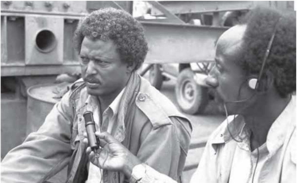
1990፡ ገለ ካብ ኣዘዘቲ ህዝባዊ ሰራዊት ብኣጋጣሚ ስርሒት ፈንቅል ምስ ጋዜጠኛታት ቃለ መጠይቕ እናካየዱ